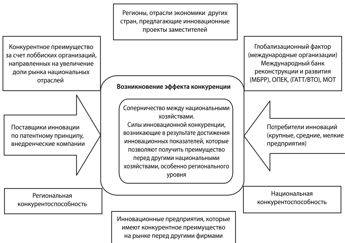
Рис. 1 Модель девяти инновационных конкурентных инициатив (разработка автора)

стран. Привлечение денежных средств и аккумуляция инвестиции являются главным источником для выхода страны из кризиса и должно быть построено иерархически следующим образом: