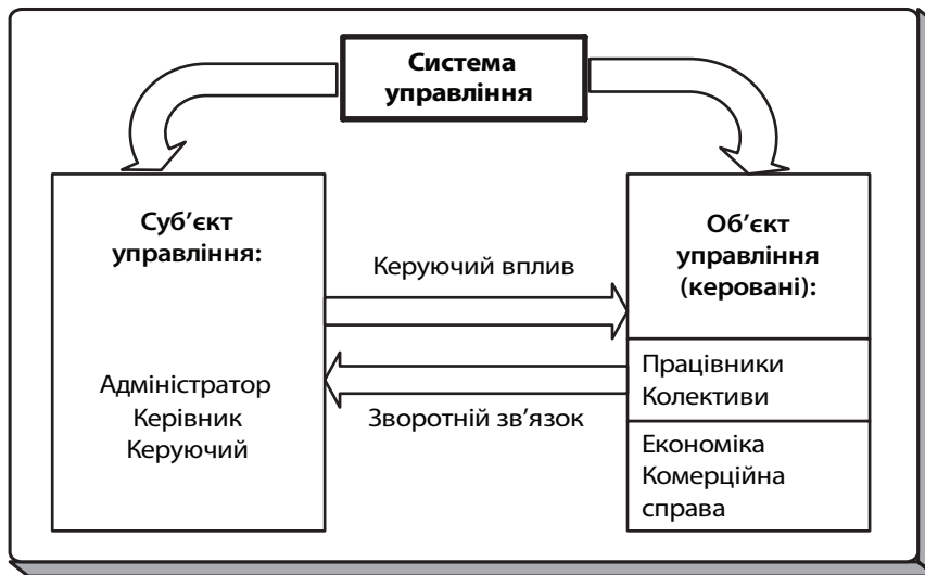
Рис. 1. Система управління комерційною діяльністю торговельного підприємства

колективи), і те, чим управляють (економіка, комерційна справа, торговий процес). Взаємодія суб'єктів і об'єктів за допомогою управлінських впливів і зворотного зв'язку дозволяє цілеспрямовано управляти всебічної діяльністю підприємства. Дану систему управління наведено на рис. 1 .