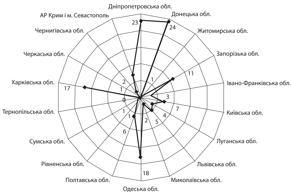
Рис. 1. Кількість зареєстрованих страхових компаній по регіонах України на 2010 р.