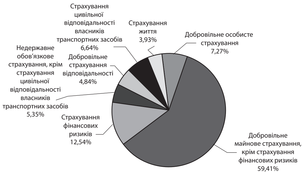
Рис. 3. Структура чистих страхових премій, %

ня страховими послугами у 6 – 7 разів є нижчим, ніж у розвинених державах світу; за експертними оцінками, вітчизняні страхові компанії страхують лише 10% від можливих страхових ризиків, тоді як в розвинених країнах цей показник складає 90 – 95%.