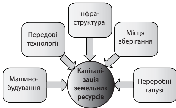
Рис. 2. Складові капіталізації земельних ресурсів