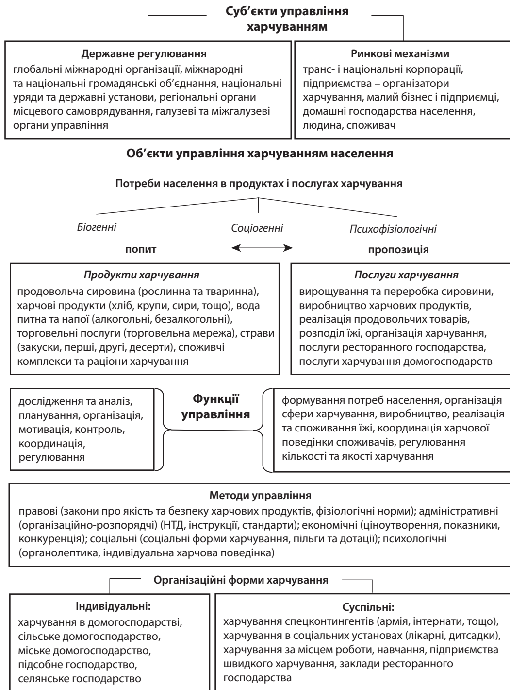
Рис. 3. Схема механізму управління харчуванням населення