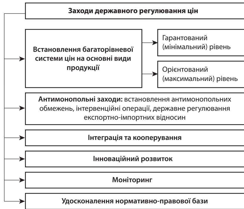
Рис. 2. Пріоритетні напрями державного регулювання цін в галузі АПК

ства і технологічно пов'язаного з ним промислового виробництва з метою одержання кінцевої продукції із сільськогосподарської сировини і досягнення більшої економічної вигоди завдяки взаємній матеріальній зацікавленості і відповідальності всіх учасників агропромислового виробництва за кінцеві результати господарювання [10, с. 75].