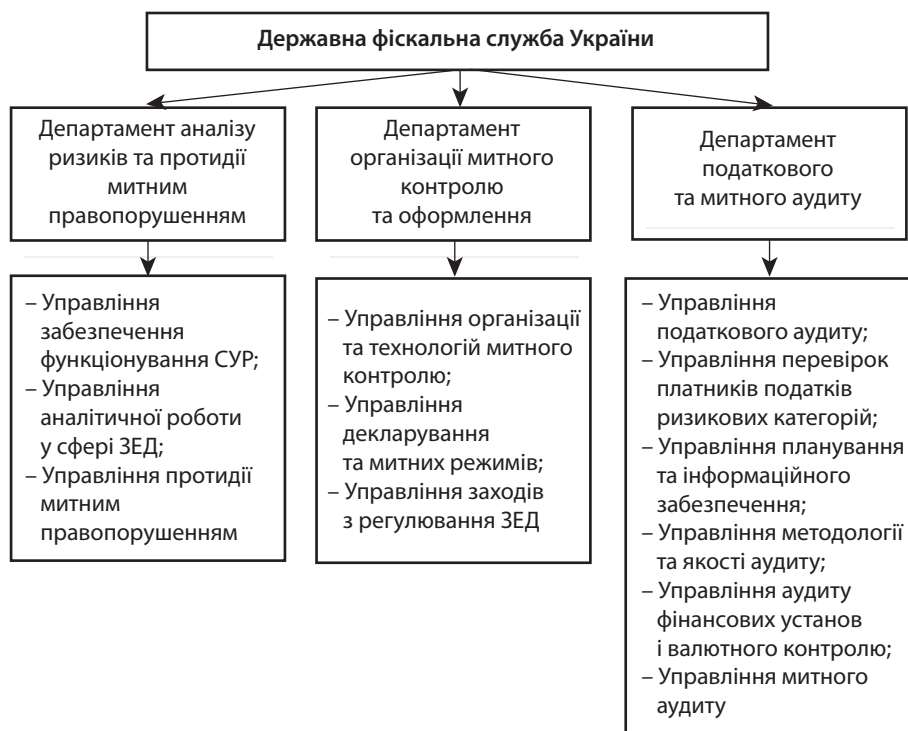
Рис. 1. Структура управління системою митного аудиту в Україні