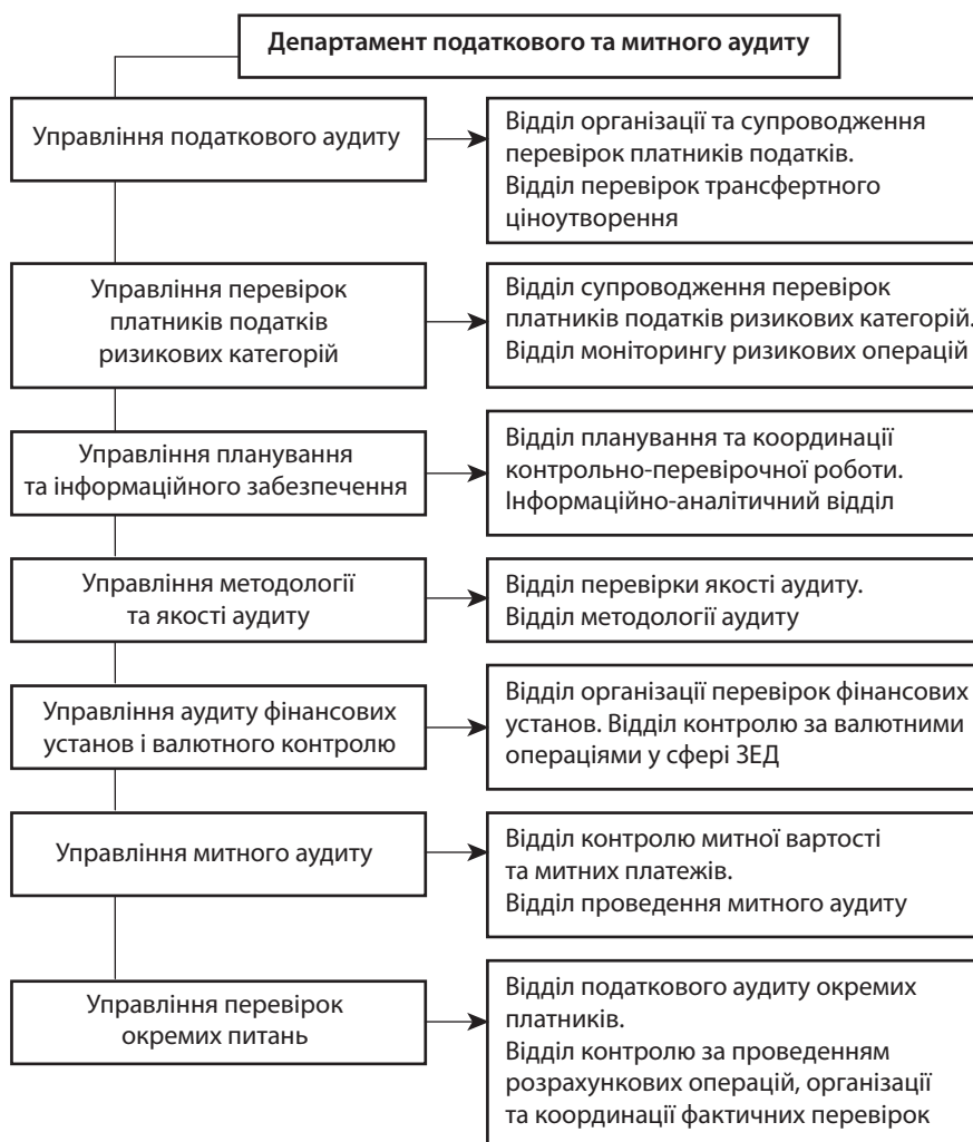
Рис.2. Структура Департаменту податкового та митного аудиту ДФС