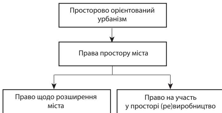
Рис. 2. Концептуальна рамка розвитку міста за Ю. Жу [6, р. 199]

Таким чином, як це випливає з рис. 2, розвиток будь-якого столичного міста та його перспективне розширення потребують надзвичайно ретельного аналізу меж його ідентифікації – як такої, що діє станом на цей час, так і тієї, що потребує прогнозного оцінювання на період 5, 10, 15, 25 років, що зробити доволі важко в силу значної фінансової турбулентності світу та його переходу до інформаційного суспільства. Втім, зробити це вкрай необхідно, адже на цьому етапі треба визначити один із напрямків стратегії розвитку: вверх-униз або ж ушир. За першим варіантом розширення місту конче необхідно буде формувати різномірну інфраструктуру і витратити значні кошти на її вдосконалення та модернізацію, а також знаходити складні технічні рішення щодо існуючих і перспективних транспортних сполучень, внутрішньої логістики та управління системною міською господарства. Перевагою при цьому може стати постійно зростаюча компактність міста, натомість ризиком – зростання кількості техногенних катастроф, великих аварій та численних проявів тероризму.