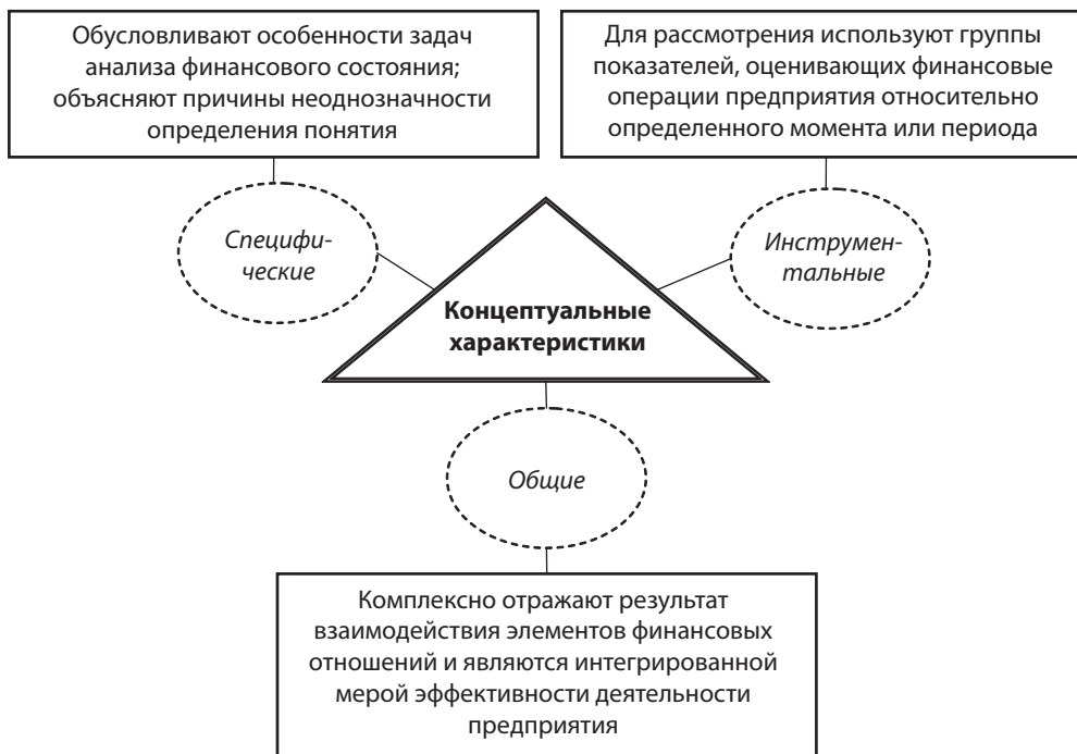
Рис. 2. Характеристики понятия «финансовое состояние предприятий»