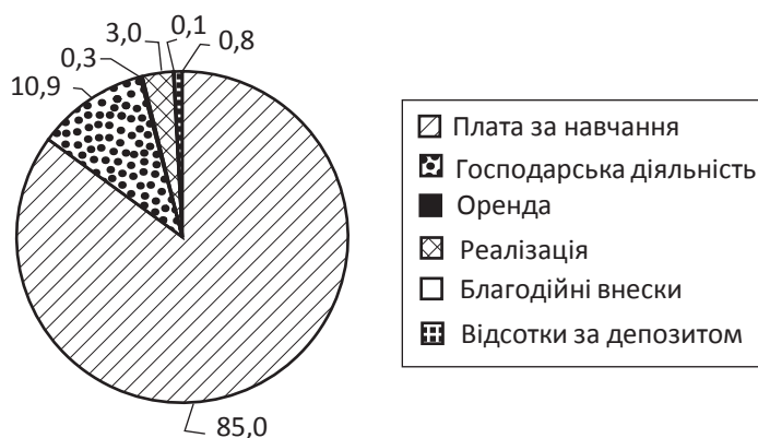
Рис. 2. Структура власних надходжень Вінницького торговельно-економічного інституту КНТЕУ у 2015 р., %