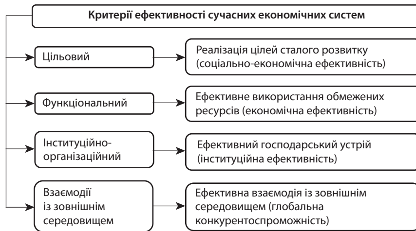
Рис. 1. Критерії ефективності функціонування і розвитку сучасних економічної системи