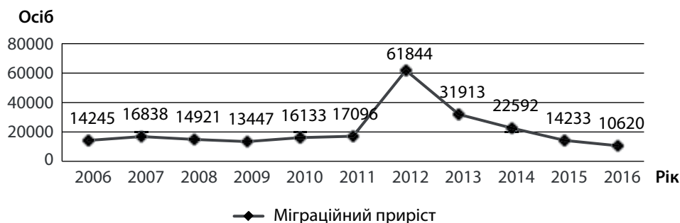
Рис. 1. Динаміка міграційного приросту людського капіталу України за період 2006–2016 рр.

На наш погляд, необхідно вдосконалення механізму державного регулювання міграційними про-