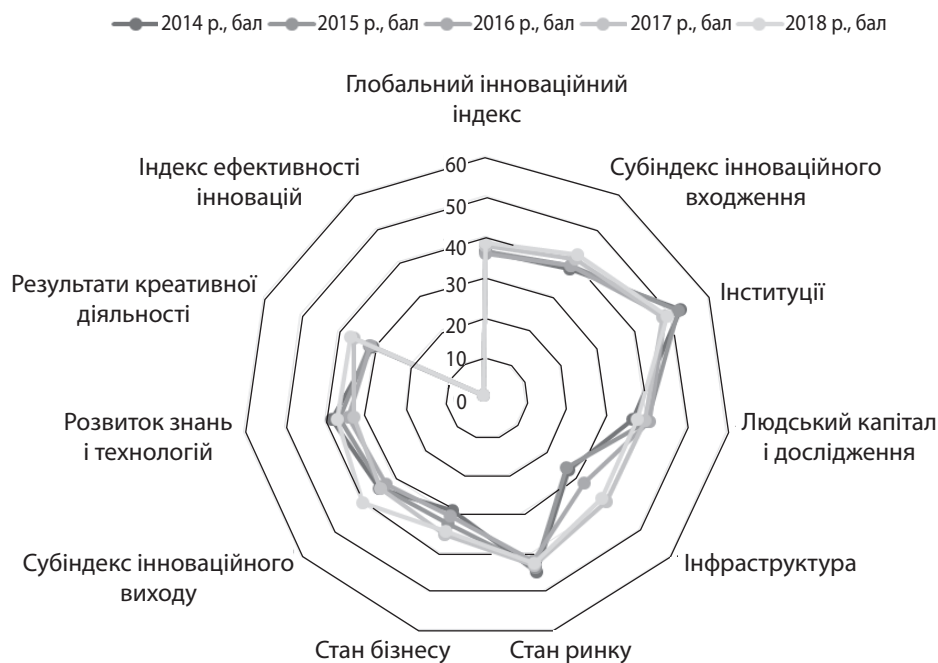
Рис. 3. Графічне відображення динаміки складових глобального інноваційного індексу України за 2014–2018 рр.

ливим показником під час визначення місця розташування економічної діяльності, стимулює конкуренцію та значно впливає на економічне зростання. Проте, на жаль, інфраструктура майже не змінила свій показник у рейтингу. Зовсім інша ситуація спостерігається в політичному середовищі: рейтинг країни протягом останніх років постійно займає 122–123 місце, а це майже передостанні місця серед країн світу. Негативними є й показники людського капіталу та досліджень, особливо це стосується рівня освіти, яка втрачає свої рейтингові місця, навіть з 2016 р. по теперішній час, займаючи 20, 30 та 34 місце відповідно. Між тим, саме ці фактори зумовлюють інноваційний розвиток.