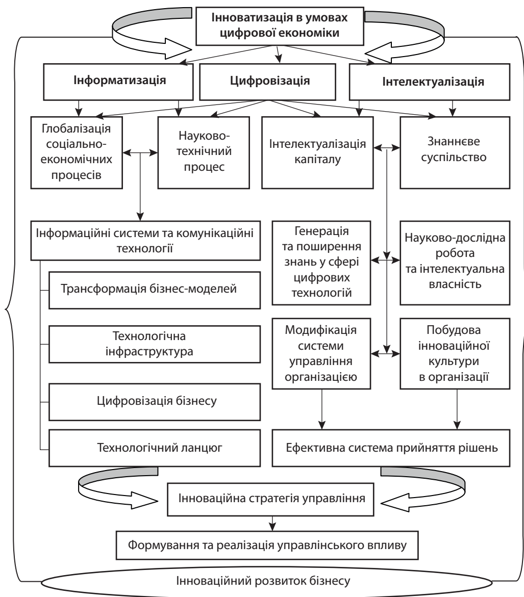
Рис. 1. Інноватизація як прогностична ідея розвитку бізнесу в умовах цифрової економіки

Теоретичне осмислення впливу зростаючих потоків даних на сучасну соціально-економічну систему можна відзначити в концепціях постіндустріального та інформаційного суспільства. Зміни у виробничих процесах, трансформація виробництва зі створення матеріальних благ на надання послуг, глобалізація економіки відзначаються теоретиками цифрової су-