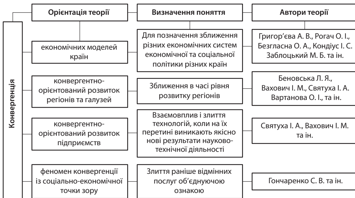
Рис. 1. Сучасний зміст процесу конвергенції