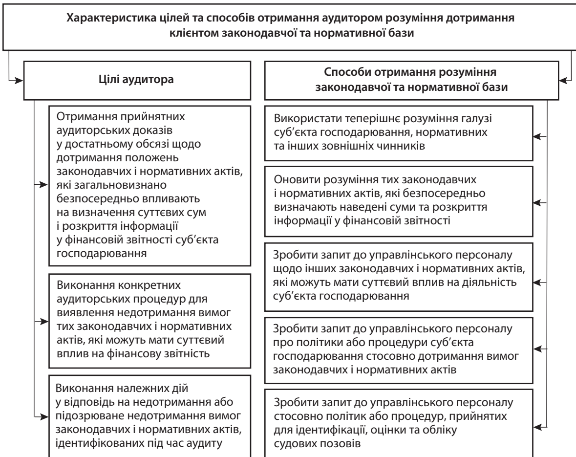
Рис. 2. Характеристика цілей та способів отримання аудитором розуміння дотримання клієнтом законодавчої та нормативної бази