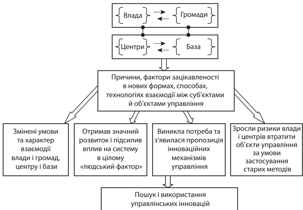
Рис. 2. Зміщення акцентів уваги від традиційних форм управління до інноваційних

довела, що такий спосіб державного стратегічного регулювання є високоефективним. Зараз у роботі з формування нових районів у масштабах обласних меж така стратегія не береться до уваги та не враховується. Не будемо це відносити до помилки або недалекоглядності реформаторів, але в науковому розгляді проблеми завдання «особливостей» району, території має право на увагу. Особливі умови, особлива територія, особливі сценарії розвитку.