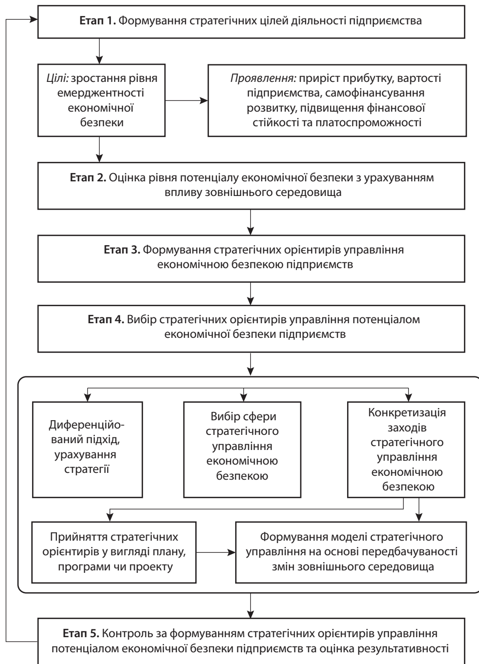
Рис. 1. Науковий підхід щодо формування стратегічних орієнтирів управління потенціалом економічної безпеки машинобудівних підприємств