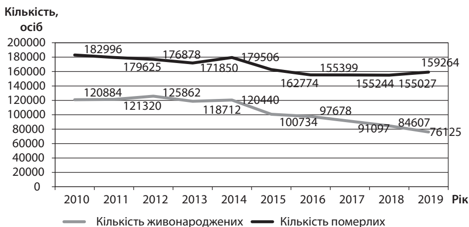
Рис. 1. Динаміка кількості народжених і померлих в Україні у січні – березні 2010–2019 рр.

Проблеми низького рівня народжуваності обумовлені симбіозом економічних і соціальних факторів. З одного боку, українські жінки відмовляються мати двох і більше дітей через низький рівень добробуту в сім'ї, а з іншого боку, – через трансформацію суспільної думки щодо репродуктивної поведінки жінки в індустріальних і постіндустріальних країнах. Згідно з даними Eurostat станом на 2017 р., середній