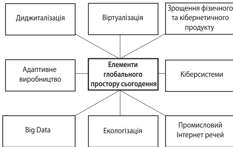
Рис. 1. Основні елементи глобального простору сьогодення