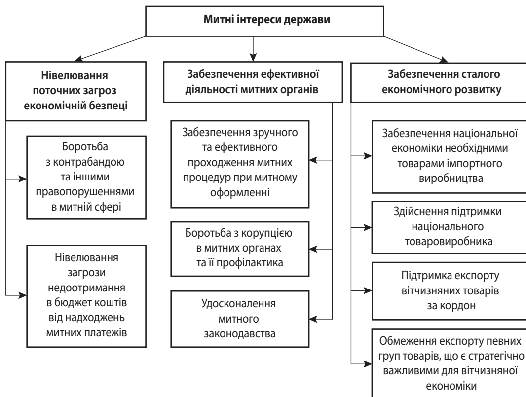
Рис. 1. Митні інтереси держави

Зазначимо, що опосередковано чи прямо митна безпека пов'язана з усіма вищезазначеними складовими економічної безпеки. Найбільш тісний зв'язок простежується між митною безпекою фінансовою та зовнішньоекономічною. Адже при здійсненні процедур митного оформлення в бюджет держави спрямовуються надходження від мита, ПДВ та акцизу, що, за своєю економічною сутністю, є податками. Таким чином, простежується прямий зв'язок між митною без-