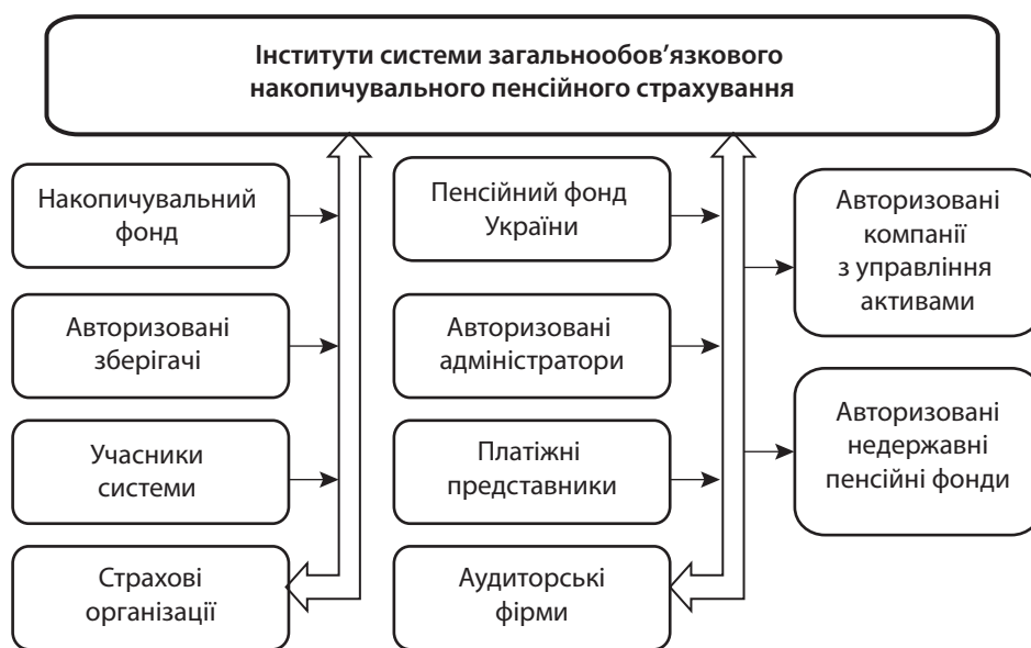
Рис. 2. Інституційне забезпечення системи загальнообов'язкового накопичувального пенсійного страхування

Адміністрування пенсійних активів обов'язкової накопичувальної пенсійної системи, відповідно до чинного законодавства, можуть здійснювати, крім