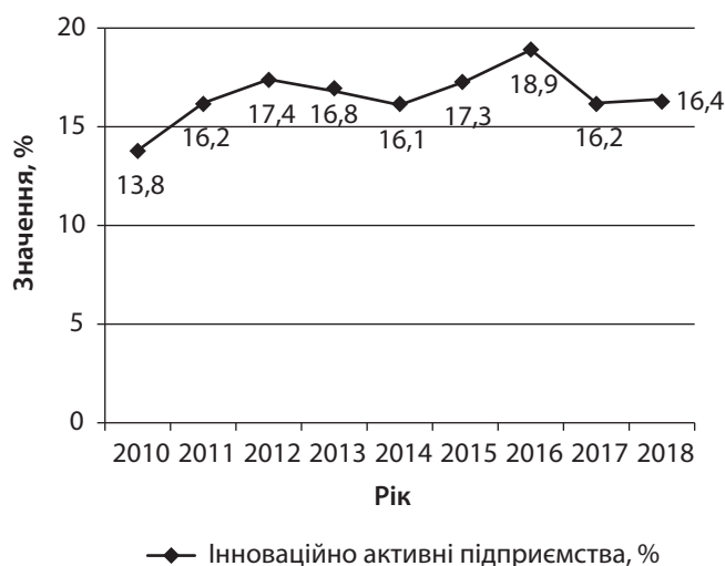
Рис. 1. Динаміка інноваційної активності підприємств у 2010–2018 рр. [4]