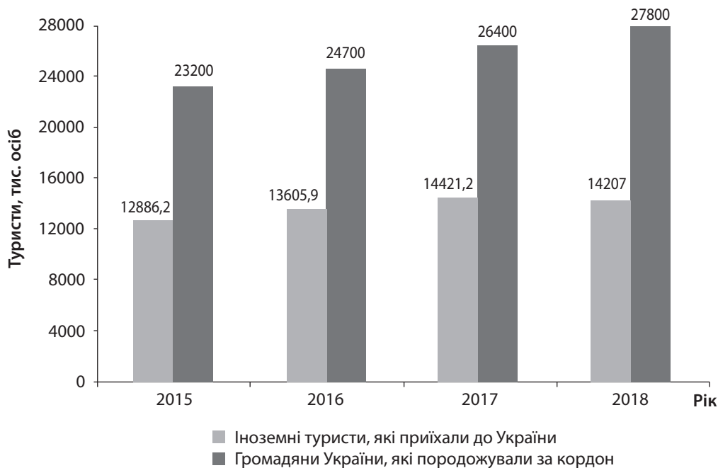
Рис. 1. Динаміка туристичних потоків у період 2015–2018 рр. [9]

Розглянемо динаміку туристичних потоків до України та з України в період 2015–2018 рр. (рис. 1).