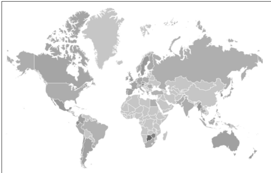
Рис. 2. Популярність пошукового запиту «dark tourism» у світі