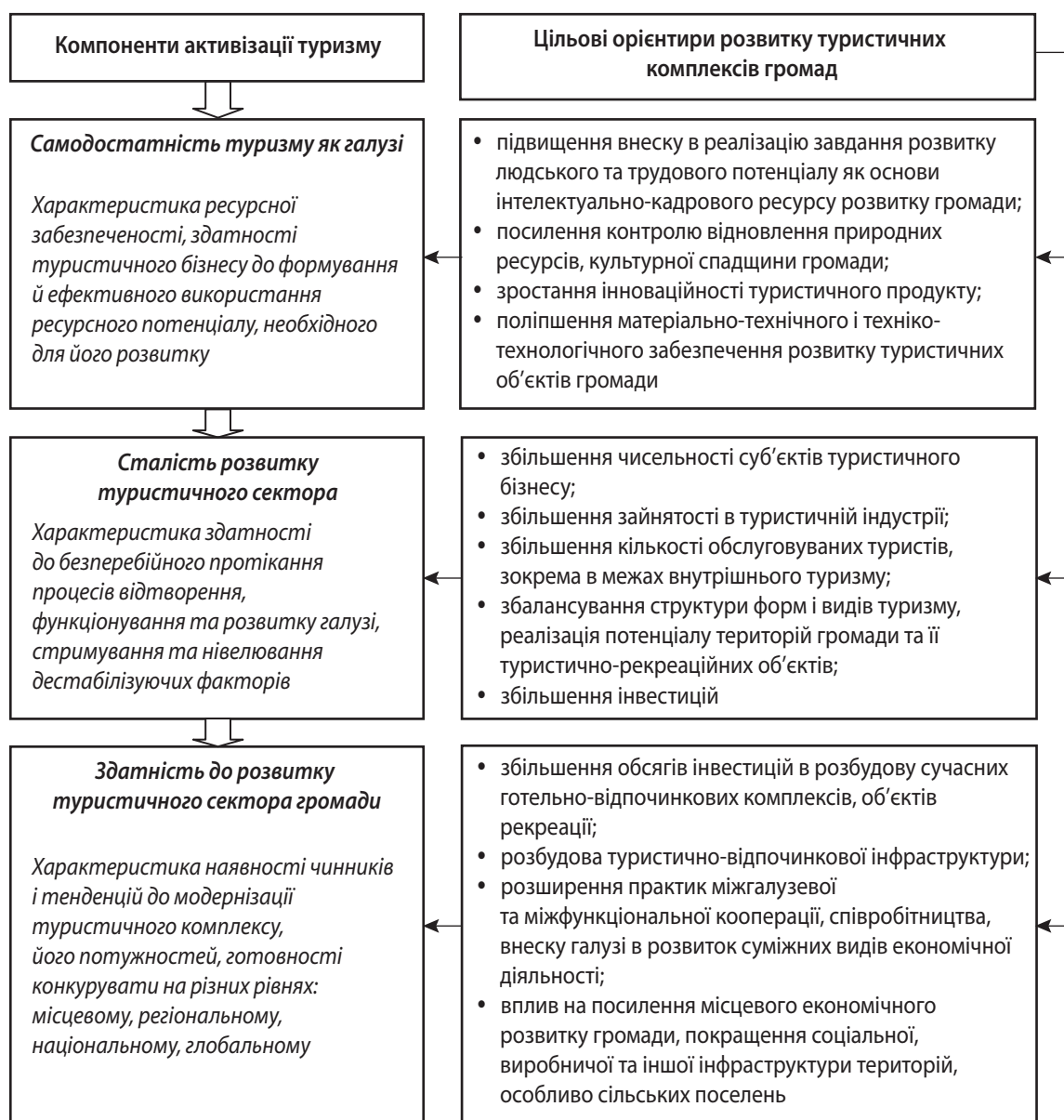
Рис. 2. Результати узагальнення стану і тенденцій розвитку туристичного комплексу та його впливу на економічну безпеку України