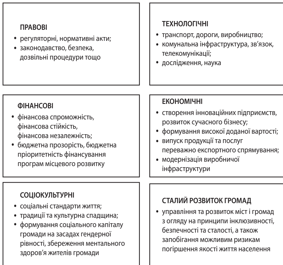
Рис. 4. Класифікація факторів, що впливають на створення унікального фіскального простору територіальної громади