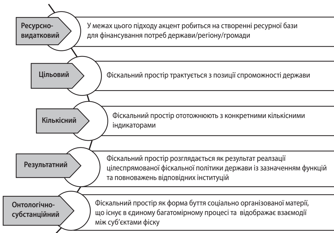
Рис. 1. Наукові підходи до розуміння економічної сутності фінансового простору

Узагальнення результатів дослідження наукових праць [2–4; 6; 9; 12–14] свідчить, що найбільш популярним серед науковців і практиків є ресурсно-видатковий підхід до розуміння сутності ФП. Серед переваг підходу зазначають структуроване збалансування джерел мобілізації фінансових ресурсів та напрямків фінансування витрат. Як недолік підходу визнають відсутність ідентифікації ФП на довгострокову перспективу. Представники цільового підходу віддають перевагу розвитку ФП на основі досягнення запланованих цілей. Проте не ідентифікують джерела формування ФП. Урахування інституційних, соціально-економічних та інших передумов формування ФП, але без визначених перспектив для його розширення, надано в кількісному підході . До переваг результатного підходу економічної сутності ФП слід віднести діагностику отриманого результату ФП заради досягнення пріоритетних цілей ТГ. Як недолік зазначають відсутність часової реалізації запропонованих програм. Представники онтоло-