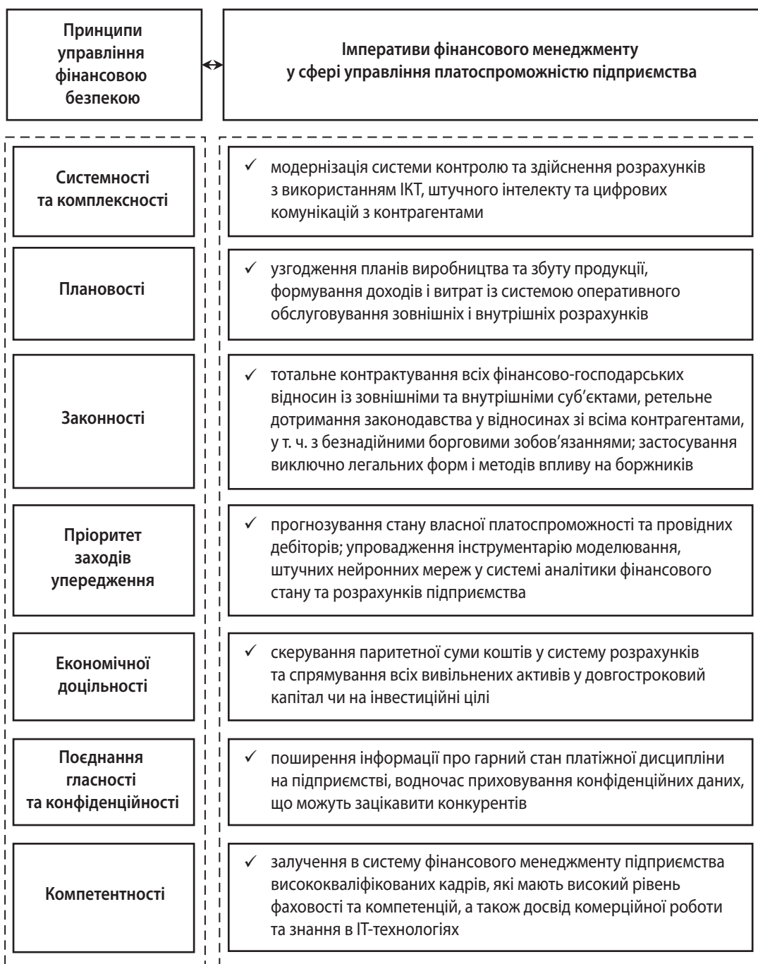
Рис. 2. Імперативи посилення платоспроможності в системі зміцнення фінансової безпеки підприємства