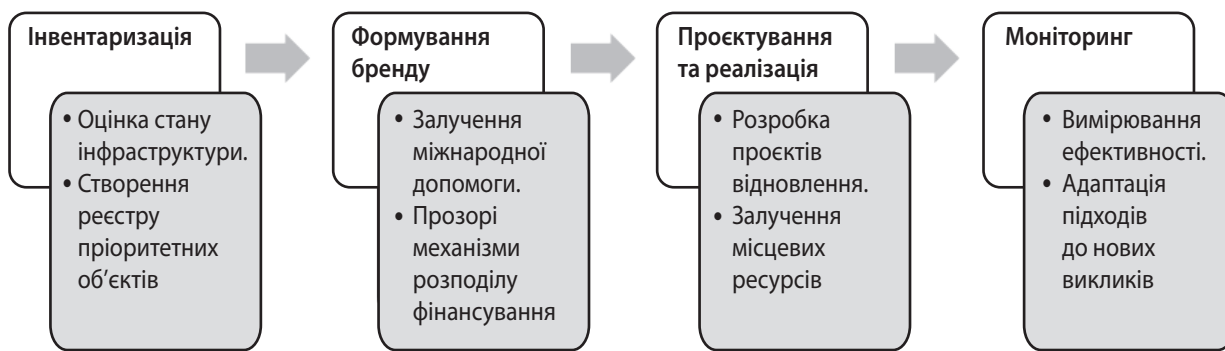
Рис. 2. Етапи реалізації моделі підтримки інфраструктури