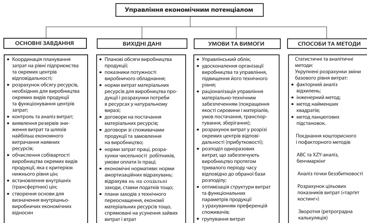
Рис. 1. Механізм управління економічним потенціалом