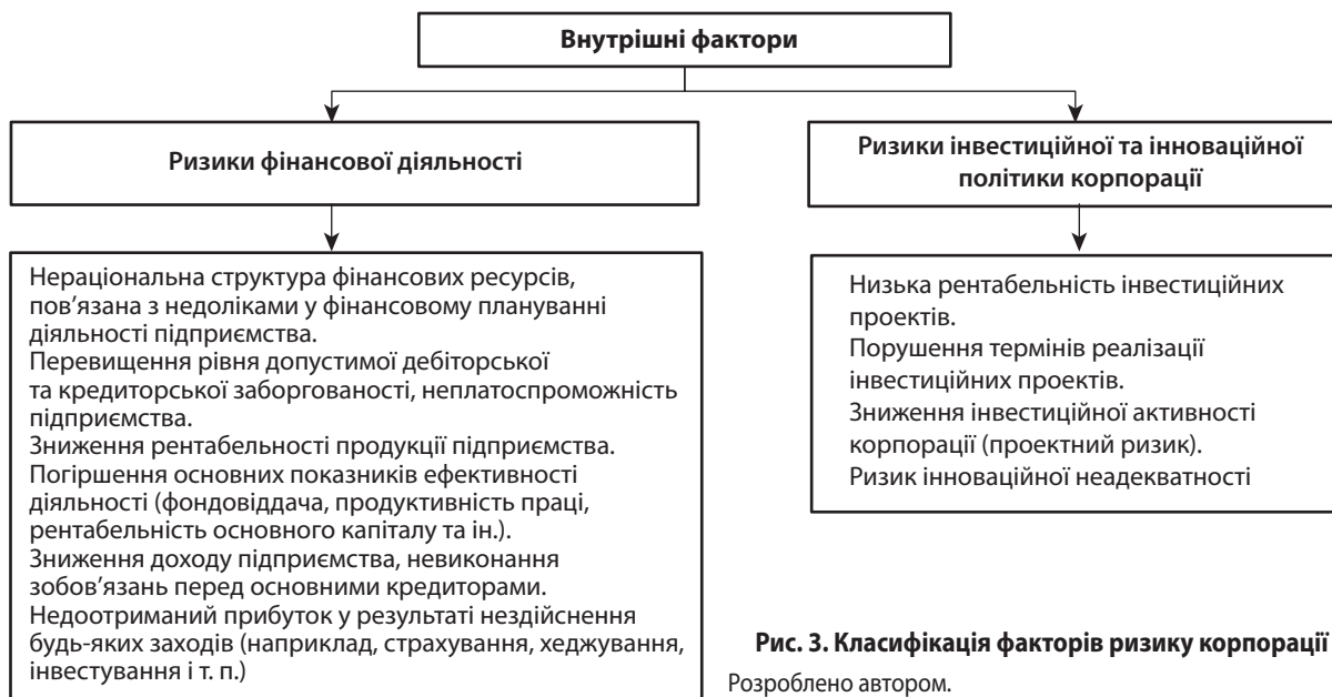
Рис. 3. Класифікація факторів ризику корпорації