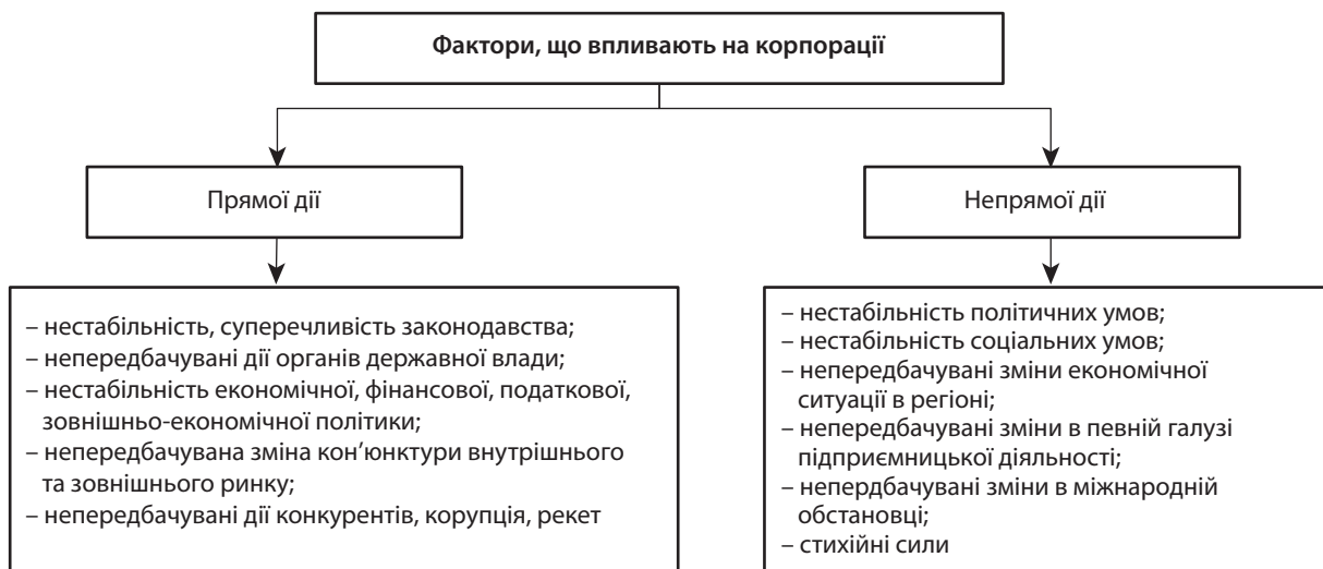
Рис. 1. Фактори ризику корпорацій