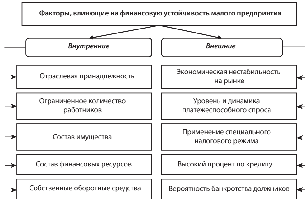
Рис. 3. Факторы, влияющие на финансовую устойчивость субъекта малого предприятия (авторское обобщение)

В работе Лысенко А. М. и Недовоз Ю. Ю. [9] предложено усовершенствование методики проведения финансовой отчетности предприятия путем поэтапного проведения двух видов анализа: экспресс-диагностики и комплексного анализа с применением системы показателей для интегральной оценки финансовой отчетности малого предприятия.