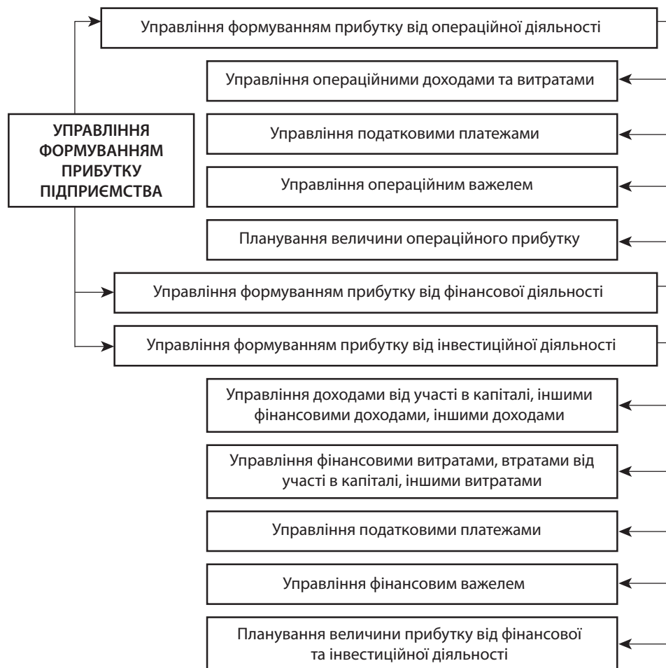
Рис. 2. Структурна схема управління формуванням прибутку підприємства

Формування прибутку підприємства пов'язане зі здійсненням операційної, фінансової та інвестиційної діяльності (рис. 2).