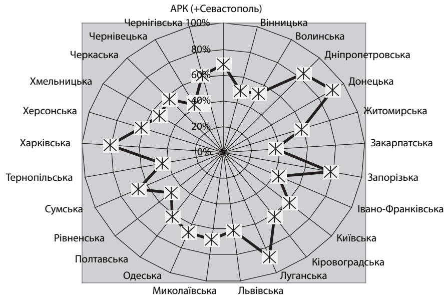
Рис. 1. Рівень урбанізації за областями України у 2010 р. (%) [4]

Найменша концентрація міст в Рівненській, Закарпатській, Чернівецькій, Житомирській та Волинській областях — по 11 міст в кожній області, а також у Миколаївській та Херсонській областях — по 9 міст. Відносно загального числа міських населених пунктів в Україні питома вага міст складає відповідно 2,4% та 2,0% у кожній з двох вказаних груп областей.