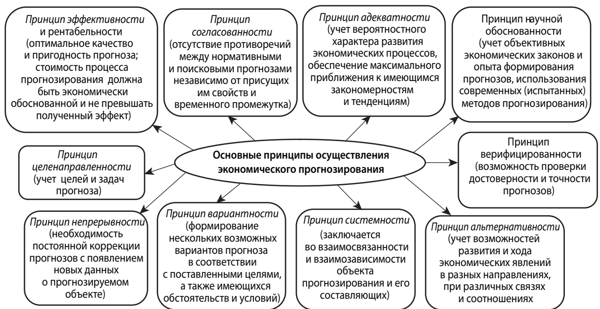
Рис. 1. Схематическое изображение основных принципов осуществления экономического прогнозирования

Среди исследуемых экономистами видов методов экономического прогнозирования наиболее распространенными являются две основные группы методов – интуитивные и формализованные. Интуитивные методы применяются в тех случаях, когда в связи со сложностью объекта прогнозирования невозможно принять во внимание влияние многих факторов. Эти методы прогнозирования могут реализовываться единолично (индивидуальные методы) или группой экспертов (коллективные методы). К индивидуальным интуитивным методам прогнозирования относятся методы интервью, аналитический, сценарный и психоинтеллектуальная генерация идей, тогда как к коллективным интуитивным – методы «комиссий», коллективной генерации идей («Мозговой штурм»), «Дельфи», «Паттерн» и матричный метод. Формализованные методы экономического прогнозирования используются при условиях относи-