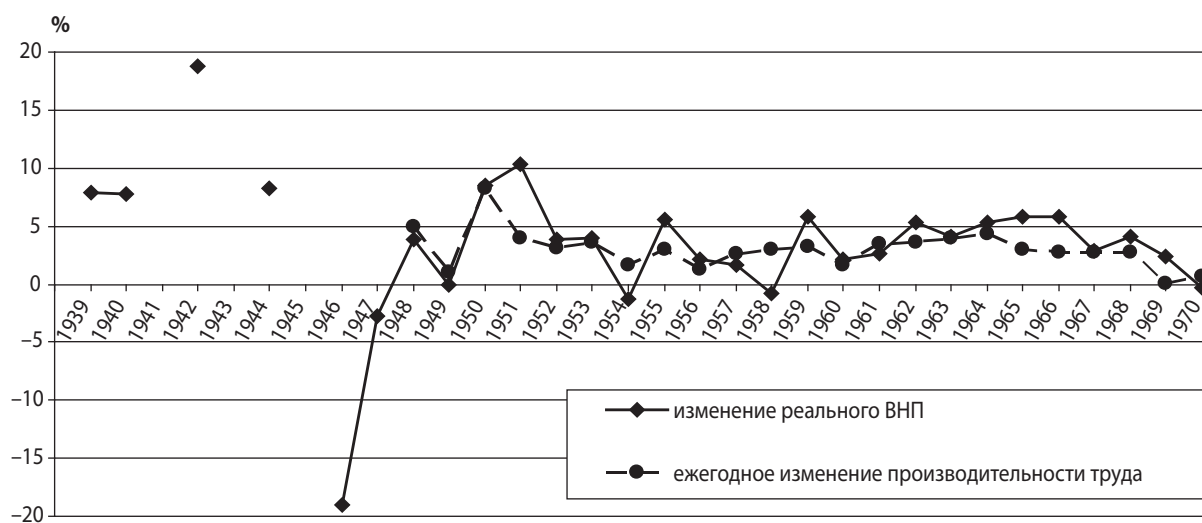
Рис. 1. Динамика реального ВВП и производительности труда в США в рамках IV-го технологического уклада

Понятно, что производительная сила труда является квинтэссенцией не только знаний и умений наемного работника, но и, в первую очередь, совершенства средств производства и технологий организации – эксплуатации наемного труда. Поэтому те процессы, которые ныне принято называть инновациями, являются важной компонентой развития общественной производительной силы труда и в то же время – тем порожаемым самим по себе изнутри себя капиталистической экономикой циклическим процессом, что представлен в трудах К. Маркса выделением материальной основы 10-летних циклов развития капиталистического производства – выбытие оборудования во время кризиса и новые массовые закупки во время экономического подъема. В дальнейшем эта идея нашла развитие в трудах Н. Кондратьева: «...ритм больших циклов есть отражение ритма в процессе расширения основных капитальных благ общества» [1]. Первая эмпирическая правильность в развитии больших циклов капиталистической экономики, согласно теории Н. Кондратьева,