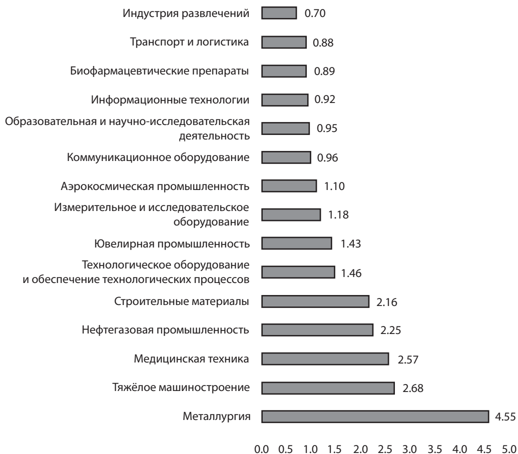
Рис. 1 Ранжирование кластерных групп Свердловской области по коэффициенту локализации