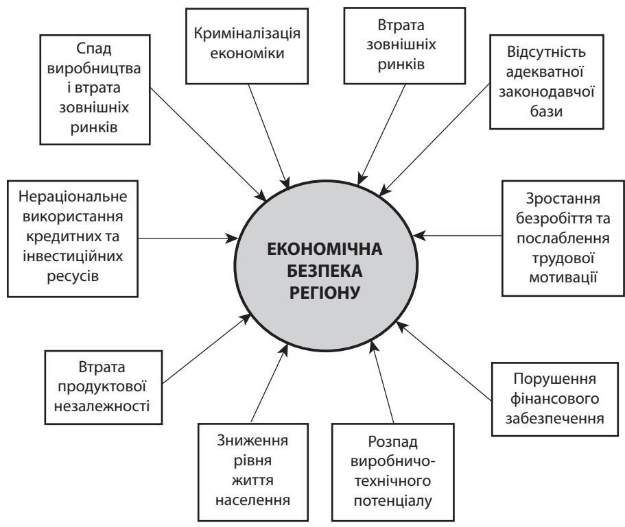
Рис. 1. Загрози економічній безпеці регіону