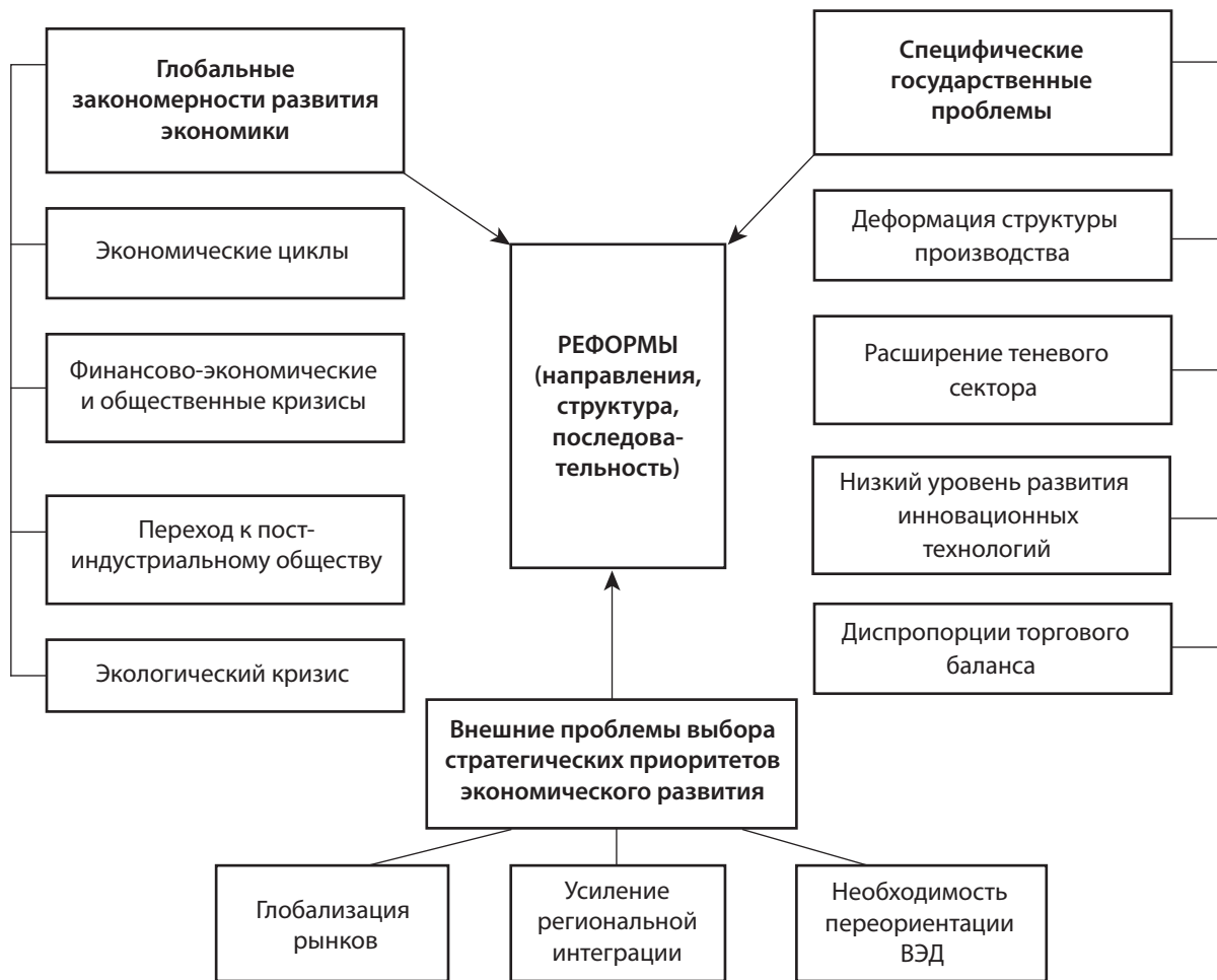
Рис. 2. Факторы, определяющие направления, структуру и последовательность реформирования экономики страны и ее регионов

Учет влияния представленных факторов и алгоритм проведения научных исследований, предложенный в работе [6], позволяет выделить такие этапы актуализации сущности понятия «реформа»: