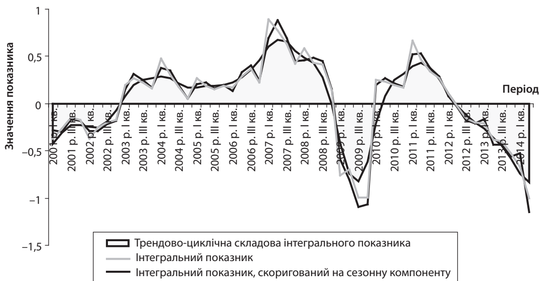
Рис. 3. Циклічна динаміка впливу зовнішніх факторів на ризик фінансової неплатоспроможності металургійних підприємств за 2001 – 2014 рр.

Протягом циклу розвитку зовнішніх загроз фінансової неплатоспроможності підприємств тривалістю в 54 квартали інтегральний показник набуває від'ємних значень за період 2001 – 2002 рр., 2009 р. і з II кварталу 2012 р. по II квартал 2014 р., що свідчить про сукупний