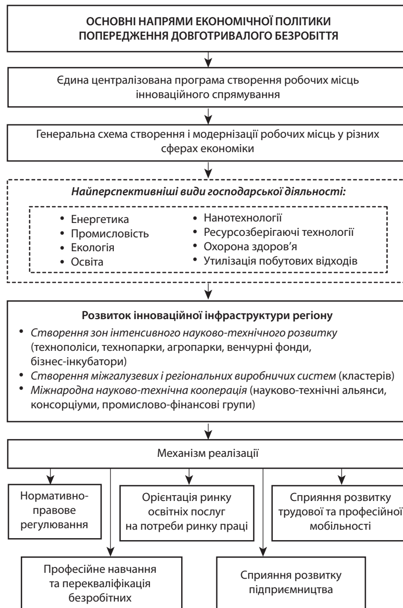
Рис. 3. Концептуальний підхід до формування системи заходів попередження довготривалого безробіття Карпатського регіону