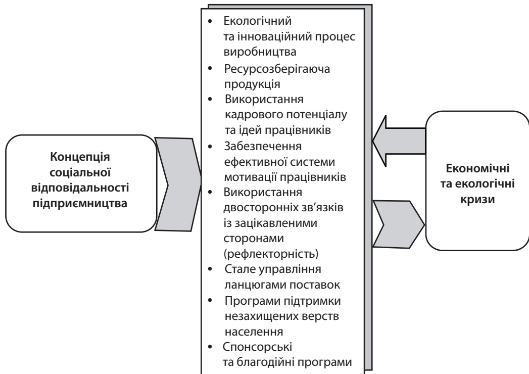
Рис. 1. Процес запровадження соціальної відповідальності підприємництва як інструменту подолання економічних та екологічних кризових періодів