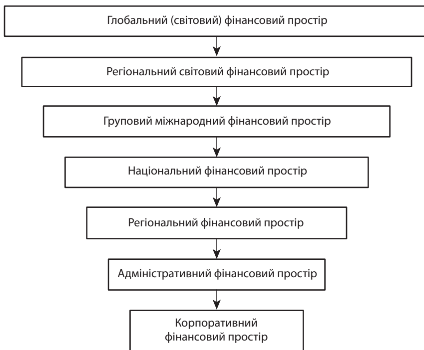
Рис. 2. Місце регіонального фінансового простору в архітектурі світового та національного простору

Як зазначає В. Чужиков, у більшості зарубіжних країн склалась три ланкова система управління територіальним соціально-економічним розвитком. Поряд з центральними органами влади управлінською діяльністю займаються великі регіональні та локальні територіальні управлінські структури.