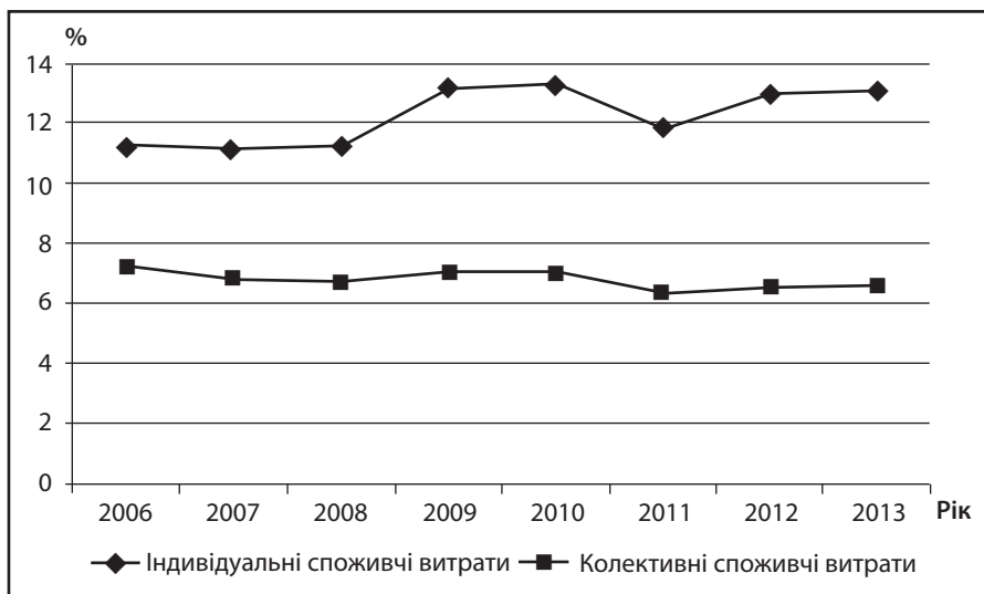
Рис. 4. Частка колективних та індивідуальних споживчих витрат у ВВП в Україні у 2006 – 2013 рр., %