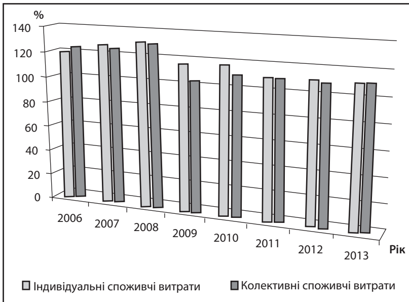
Рис. 3. Динаміка колективних та індивідуальних споживчих витрат в Україні у 2006 – 2013 рр., % до попереднього року

Таким чином, у структурі державного споживання можна виділити такі деформації: