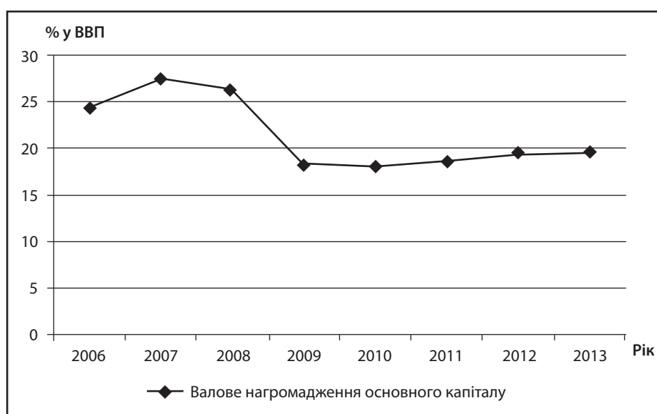
Рис. 2. Динаміка валового нагромадження в Україні у 2006 – 2013 рр., % у ВВП