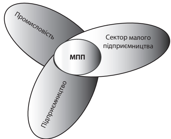
Рис. 1. Місце і роль МПП у структурі національного господарства

Нормативна база з підтримки малого промислового підприємництва може бути представлена двома блоками документів: