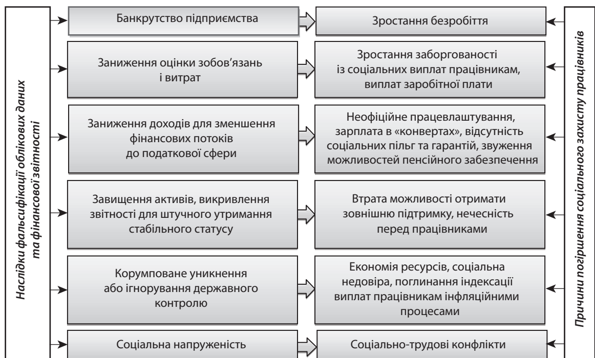
Рис. 1. Причинно-наслідковий зв'язок між обліковими фальсифікаціями та погіршенням соціального захисту працівників [2, с. 8]