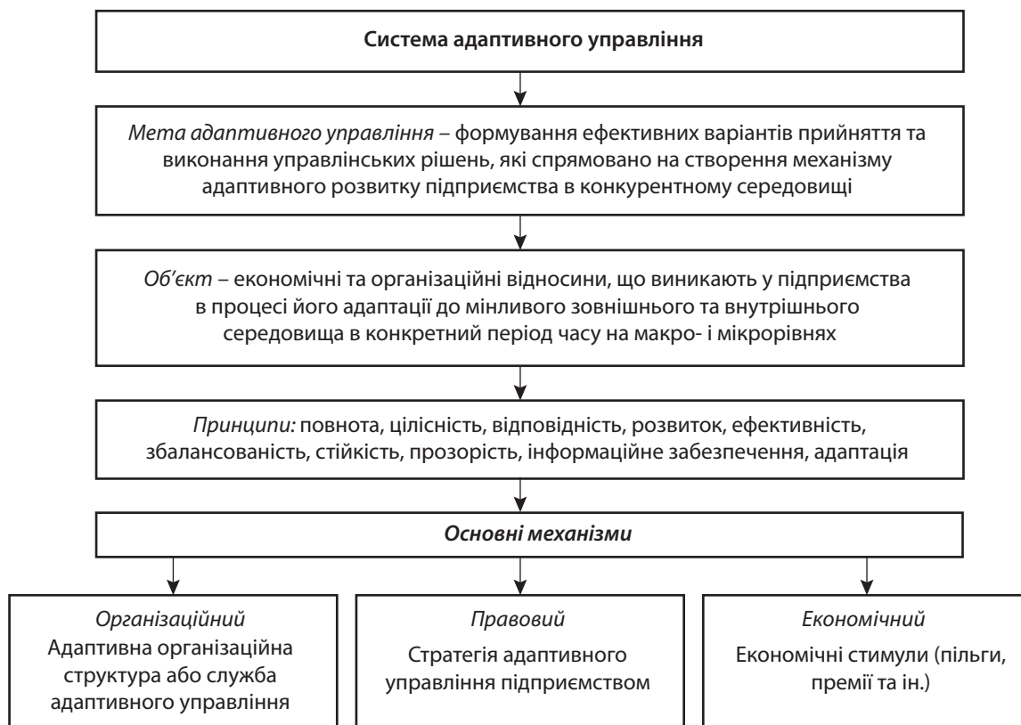
Рис. 1. Система адаптивного управління

Об'єктом системи адаптивного управління виступають економічні та організаційні відносини, що виникають у підприємства в процесі його адаптації до мінливого зовнішнього та внутрішнього середовища в конкретний період часу на макро- і мікрорівнях.