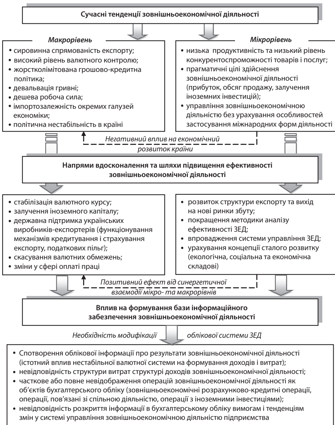
Рис. 2. Шляхи модифікації облікової системи в розрізі впливу зміни тенденцій розвитку зовнішньоекономічної діяльності: мікро- та макрорівні