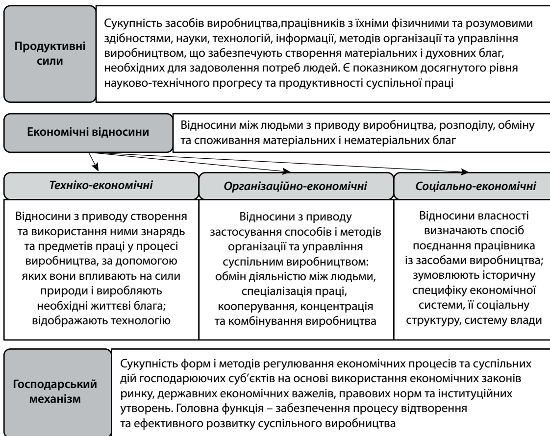
Рис. 1. Структура економічної системи

М и пропонуємо здійснювати класифікацію соціально-економічних систем за територіальною (просторовою) та функціональною ознаками. Перший вид обмежується певною територією (наприклад, міста, регіону, держави, макро-решіону), тобто розглядається взаємодія сукупності елементів системи в чітко окресленій географічній одиниці. Функціональна система поєднує в собі елементи, однозначно визначити географічні межі яких неможливо або які постійно змінюються. Так, туристична галузь рекреаційного району може оцінюватися з позицій якості наявної інфраструктури – тоді до уваги приймаються лише доступні в певних межах ресурси (у межах міста чи курортного поселення тощо). Якщо ж ми хочемо дослідити вплив галузі туризму на якість життя населення регіону, то слід враховувати у тому числі й міграційні процеси, які якраз характеризуються виходом за географічні межі території.