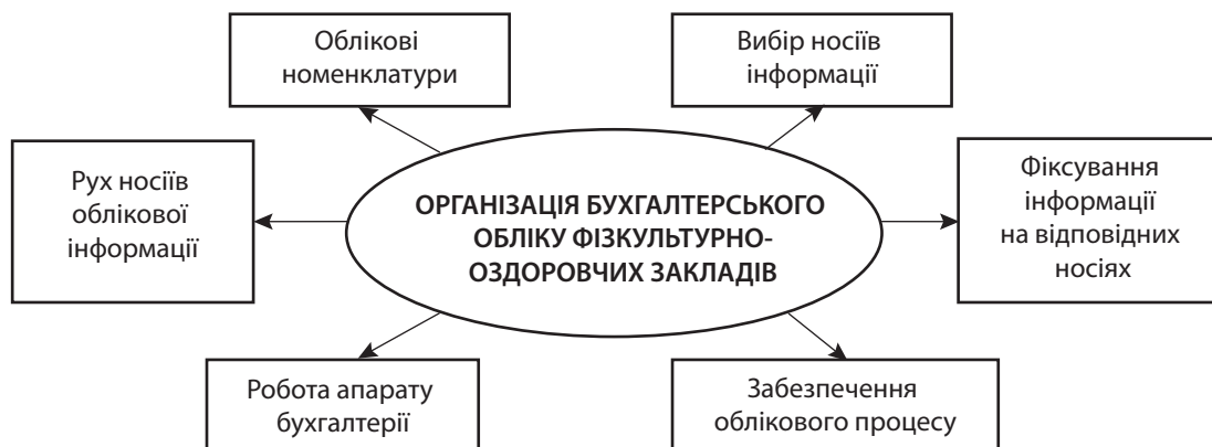
Рис. 2. Основні напрямки організації бухгалтерського обліку фізкультурно-оздоровчих закладів

Найважливіші напрямки організації бухгалтерського обліку господарської діяльності фізкультурно-оздоровчих установ наведено на рис. 2 .