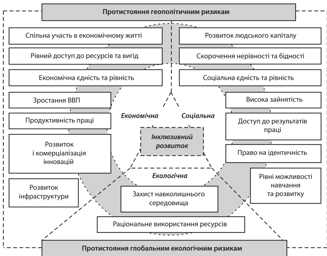
Рис. 1. Пріоритетні складові інклюзивного розвитку

Необхідність введення нового індексу обґрунтована тим, що пріоритети економічної політики мають переорієнтуватися на більш ефективну протидію незахищеності та нерівності, які супроводжують технологічні зміни та глобалізацію. Сталий збалансований розвиток, науково-технічний прогрес та інновації дадуть можливість суттєво стимулювати зростання до-