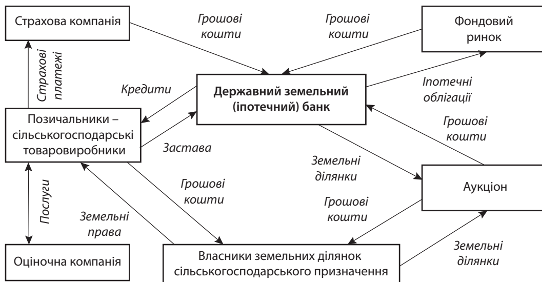
Рис. 1. Схема кредитування вітчизняних сільськогосподарських підприємств Державним земельним (іпотечним) банком